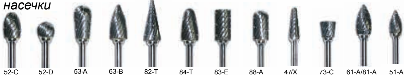
52-C 52-D 53-A 63-B 82-T 84-T 83-E 88-A 47/X 73-C 61-A/81-A 51-A