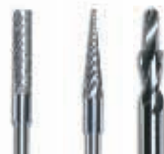
44-C 41-P 35-0780