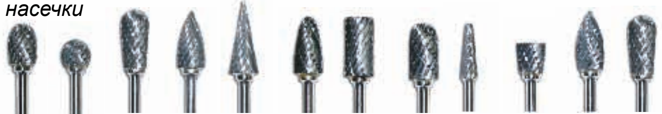
52-C/XC 52-D/XC 53-A/XC 63-B/XC 82-T/XC 84-T/XC 83-E/XC 88-A/XC 47/XC 73-C/XC 61-A/81-A/XC 51-A/XC