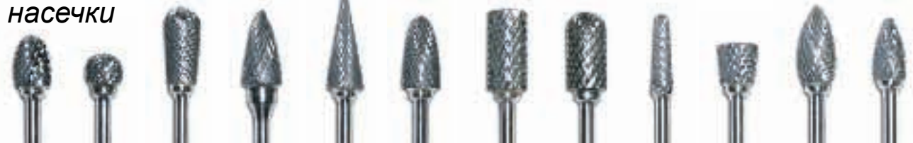
52-C/XF 52-D/XF 53-A/XF 63-B/XF 82-T/XF 84-T/XF 83-E/XF 88-A/XF 47/XF 73-C/XF 61-A/81-A/XF 51-A/XF